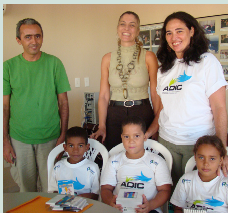
Crianças do Paço da Pátria beneficiadas pela ADIC recebem doações de material escolar