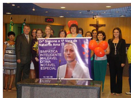
Servidores da 1ª VT de Natal prestaram homenagem a juíza na ocasião de sua posse